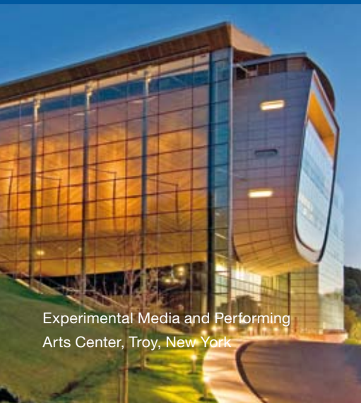
Experimental Media and Performing Arts Center, Troy, New York