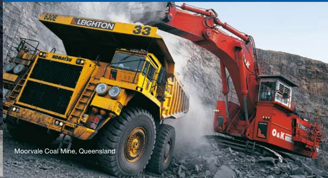
Moorvale Coal Mine, Queensland